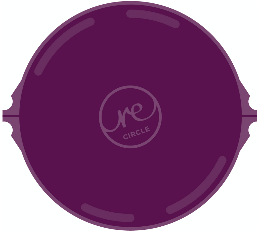
Illustration 2 : Les produits reCIRCLE sont avant tout fonctionnels : faciles à manipuler et à nettoyer, ils sont hermétiques et empilables avec ou sans couvercle.

reCIRCLE AG, Wylerringstrasse 36, CH-3014 Berne +41 31 352 82 82, info@recircle.ch, www.recircle.ch